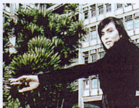
La griffe Peugeot en publicité, ou le réalisme automobile plongé dans le fantastique (de g. à dr.) : le film 406, où la ville continue d'avancer après le freinage de la voiture, la métamorphose quasi humaine de la 206, pour séduire, et la 607 « féline », qui réveille l'instinct animal